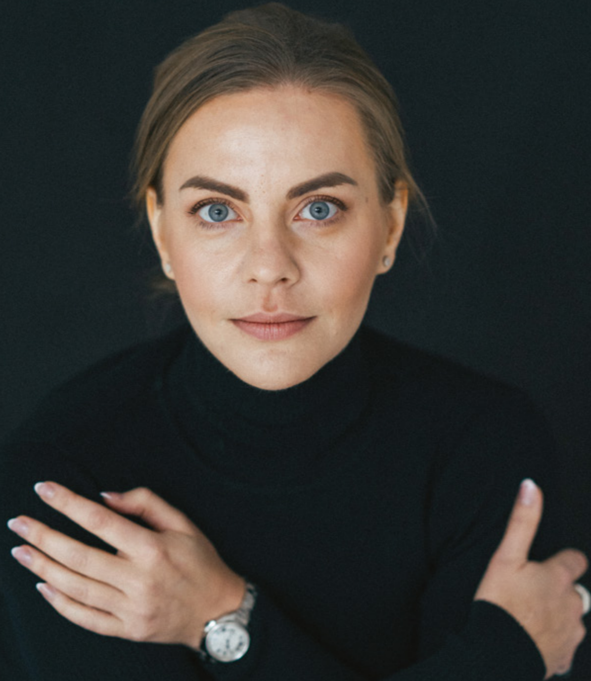
Радниця віце-прем'єрки з Європейської інтеграції, голова представництва в Україні Расмуссен Глобал