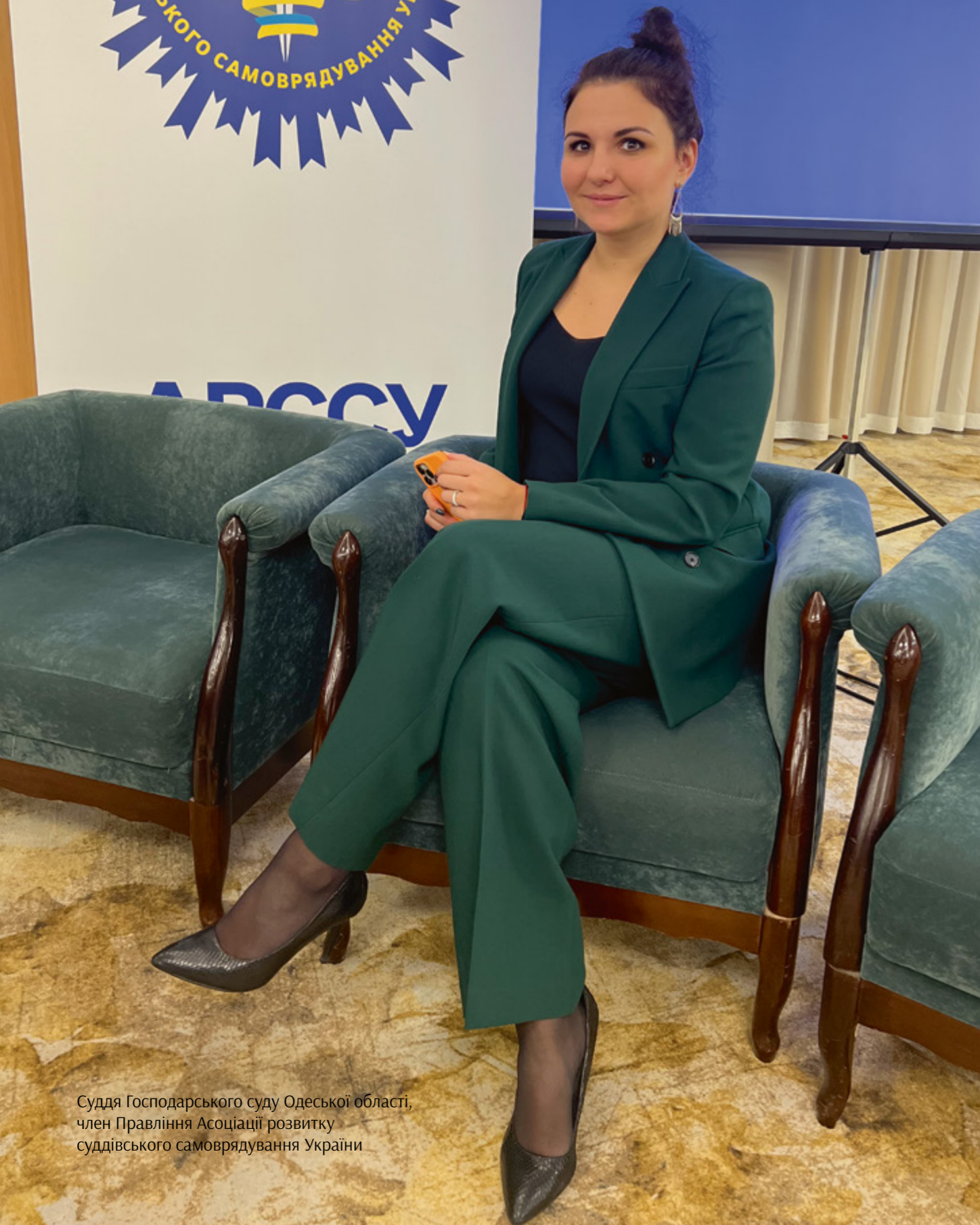
Суддя Господарського суду Одеської області, член Правління Асоціації розвитку суддівського самоврядування України