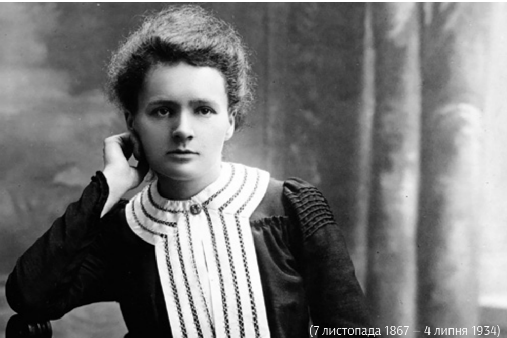
(7 листопада 1867 – 4 липня 1934)

«Домогтися результатів на благо людства»