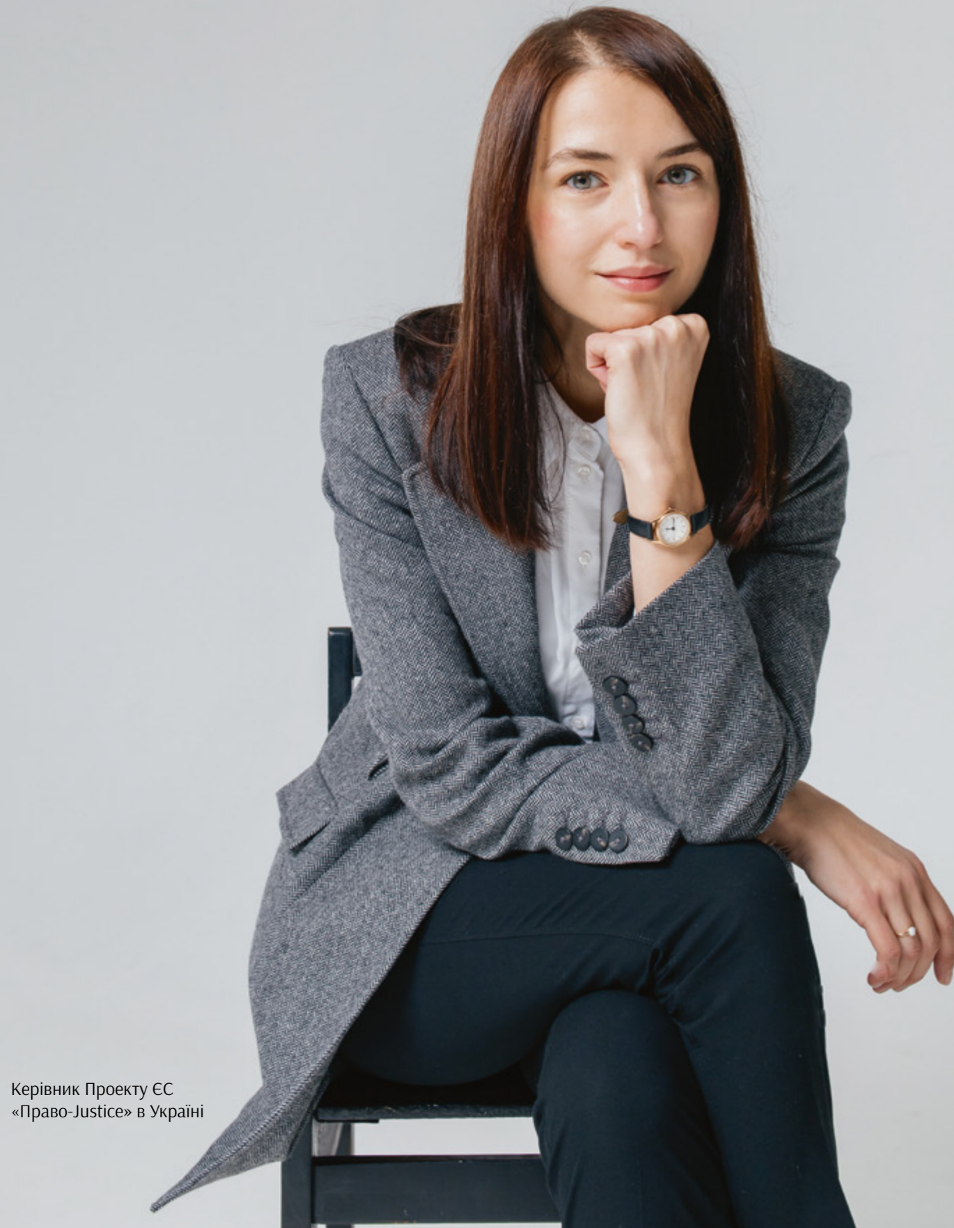
Керівник Проекту ЄС «Право-Justice» в Україні

Правосуддя — це теж сервіс, який потребує цифрової трансформації. Сьогодні Електронний суд та дистанційне правосуддя — це не лише про відповідність