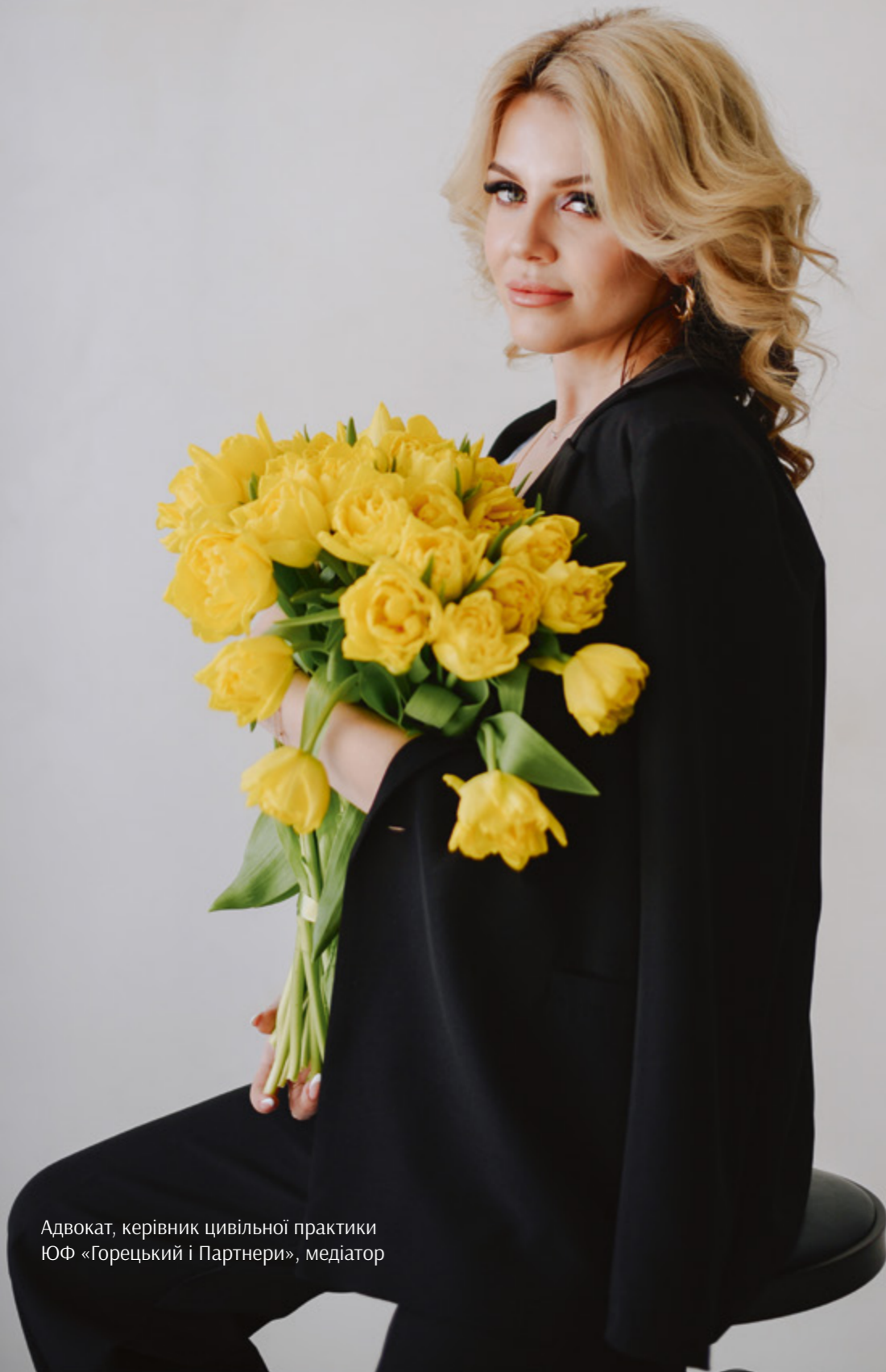
Адвокат, керівник цивільної практики ЮФ «Горецький і Партнери», медіатор

Не знаю, як у інших, але в мене точно спрацьовує одна прикмета: