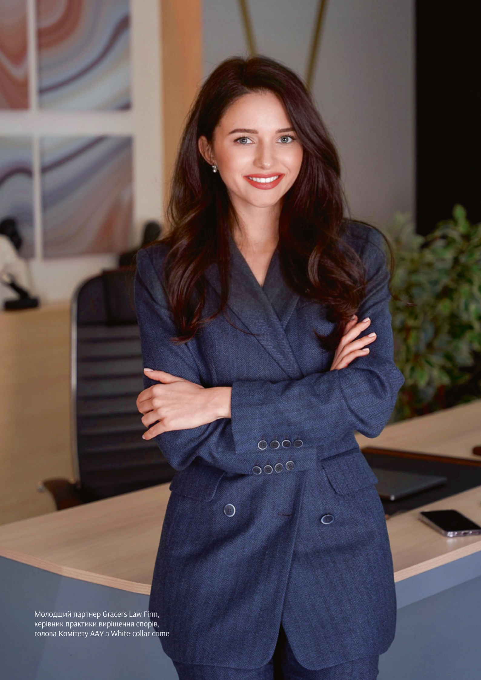
Молодший партнер Gracers Law Firm, керівник практики вирішення спорів, голова Комітету ААУ з White-collar crime