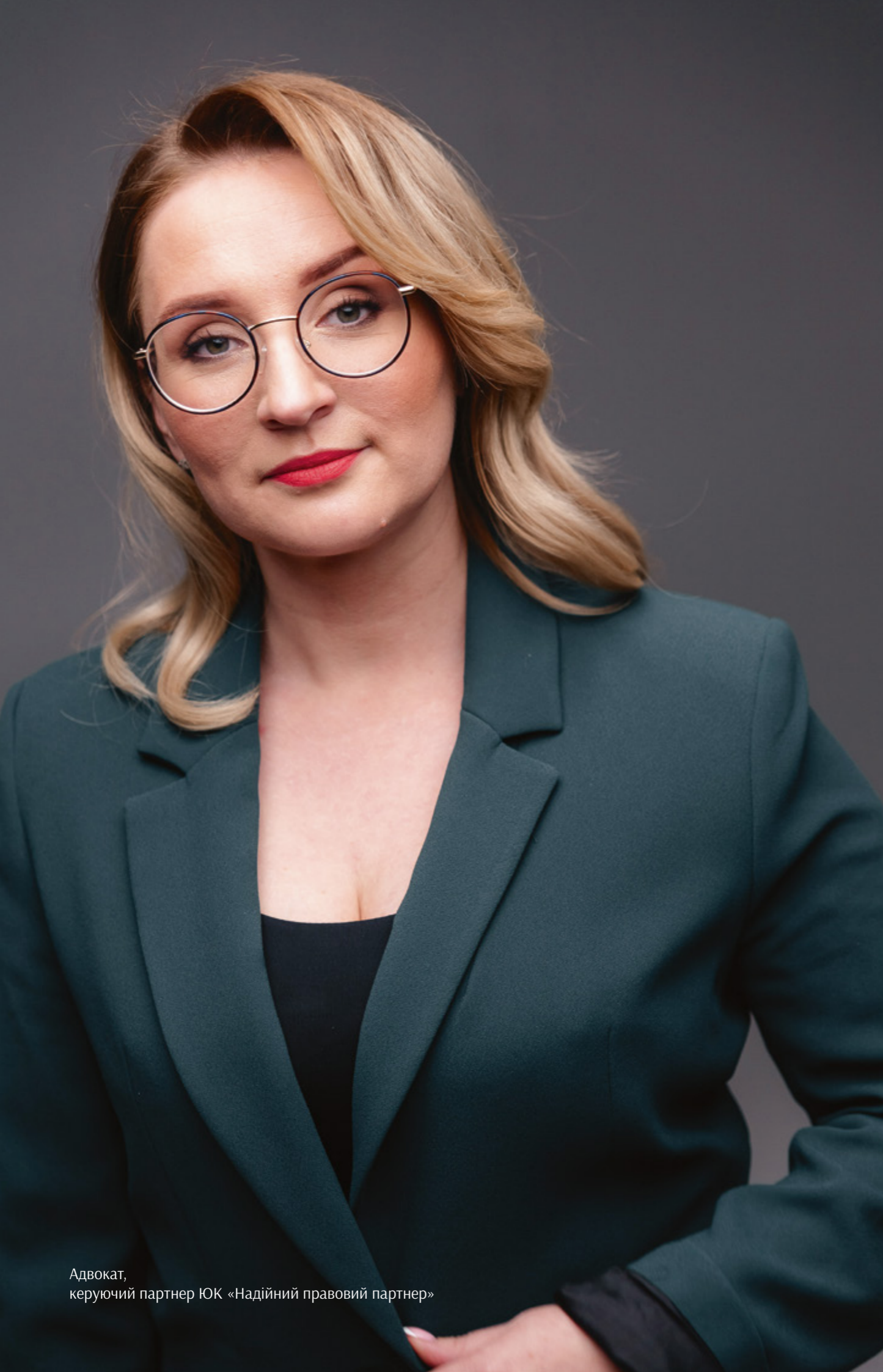
Адвокат, керуючий партнер ЮК «Надійний правовий партнер»