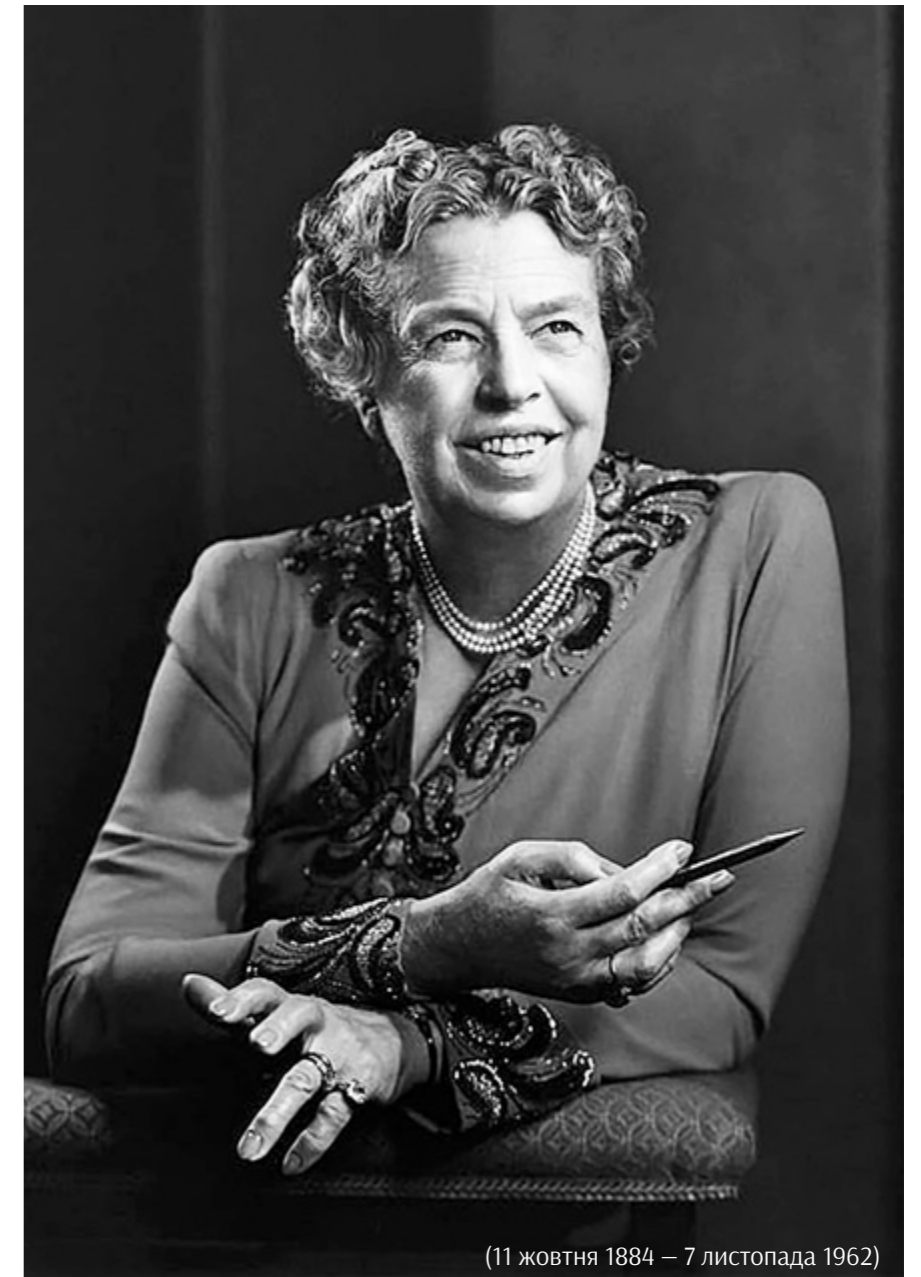
(11 жовтня 1884 – 7 листопада 1962)

У 1945 році, після смерті Франкліна Рузвельта, президент Гаррі Трумен призначив Елеонору Рузвельт представницею США на Генеральній Асамблеї ООН.