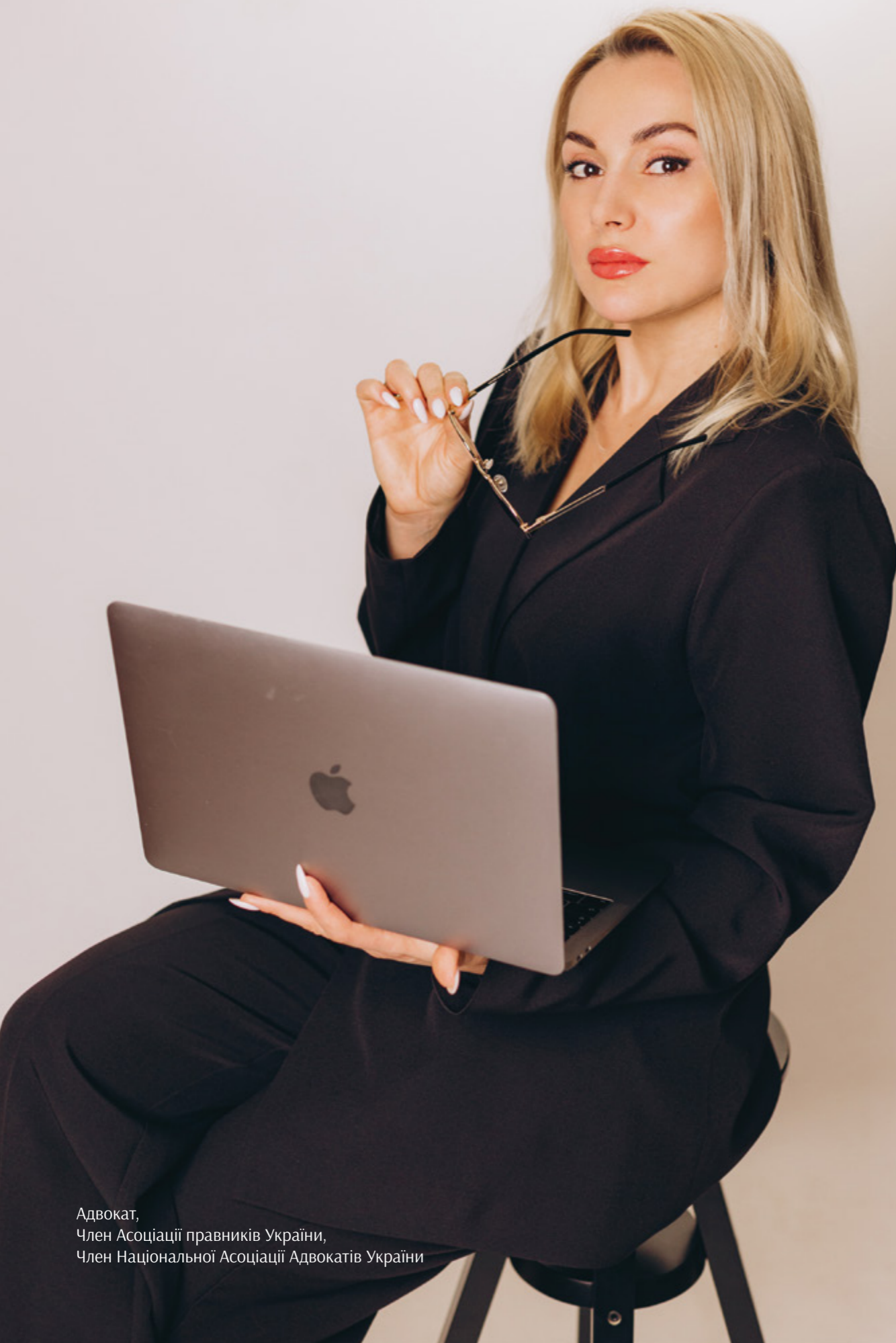
Адвокат, Член Асоціації правників України, Член Національної Асоціації Адвокатів України