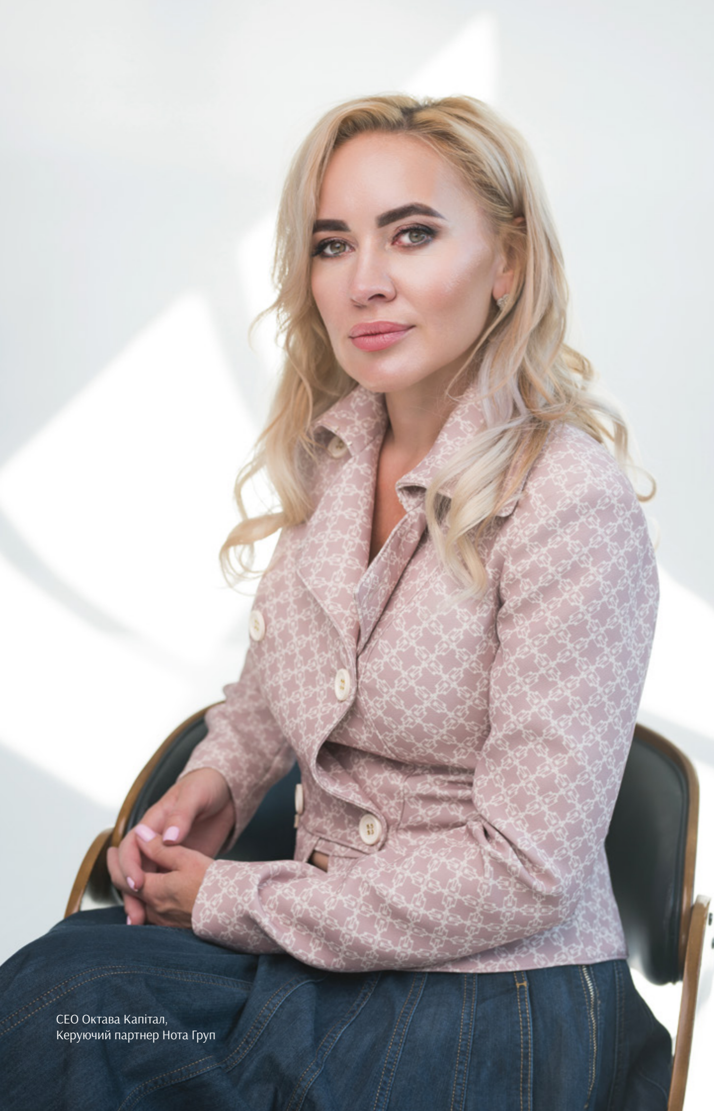
CEO Октава Капітал, Керуючий партнер Нота Груп