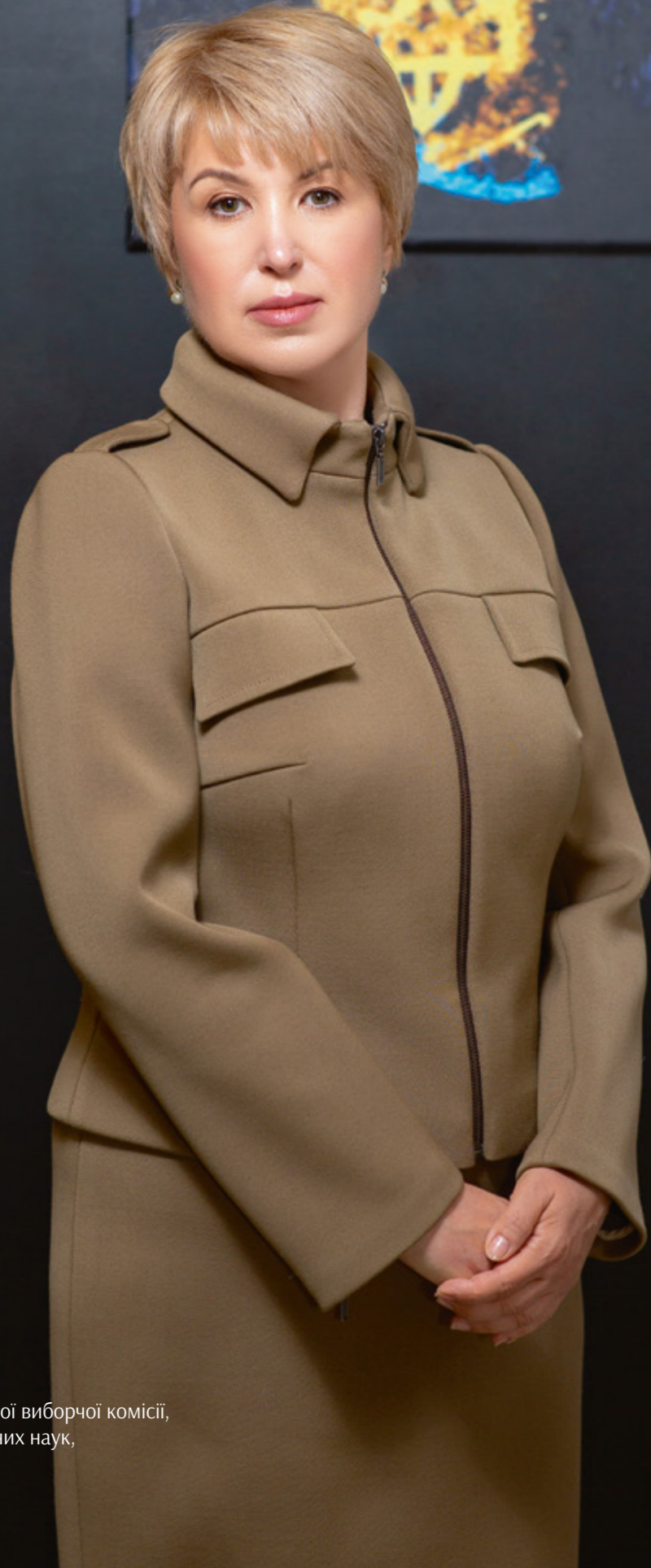
Член Центральної виборчої комісії, доктор юридичних наук, професор