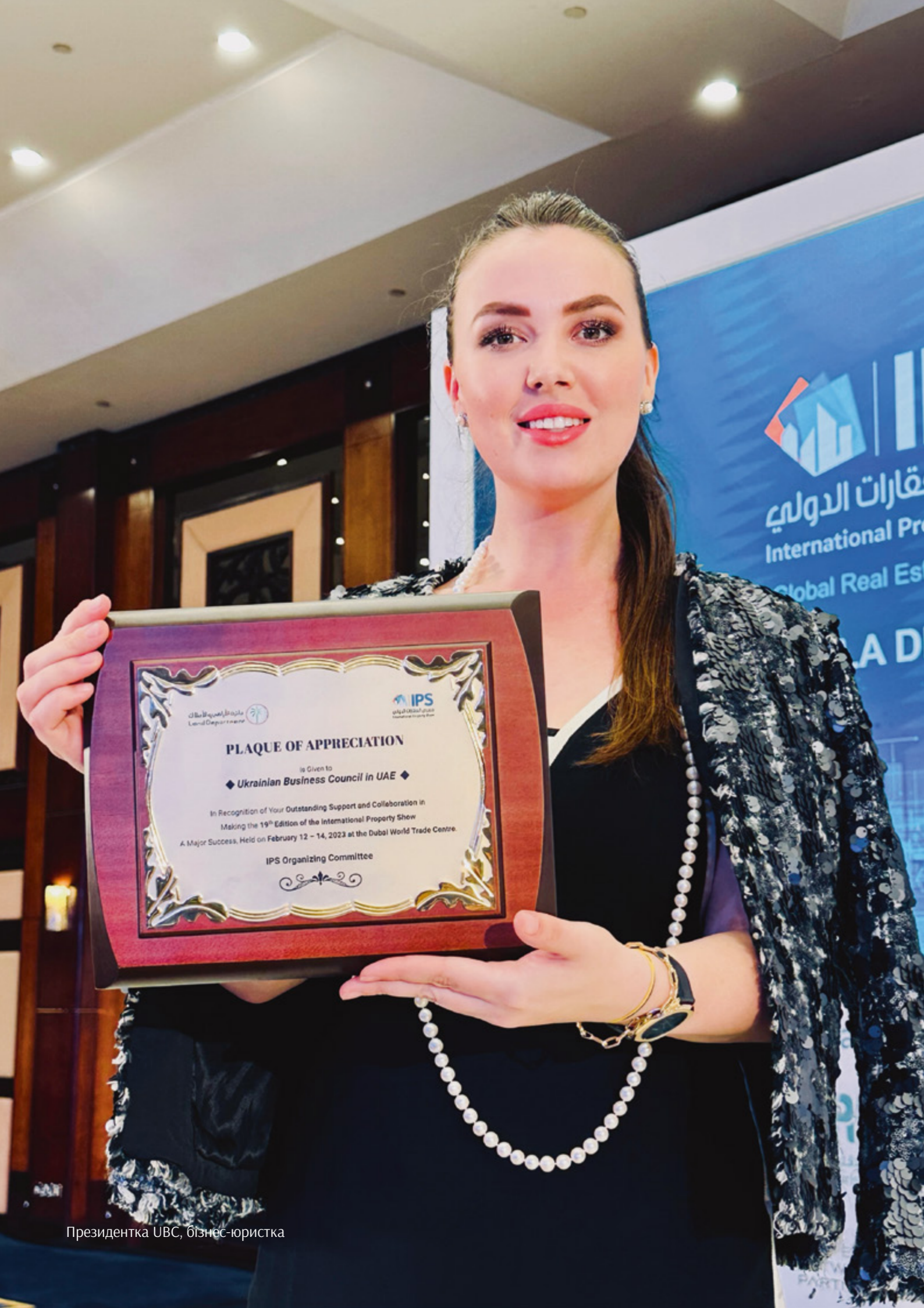
Президентка UBC, бізнес-юристка