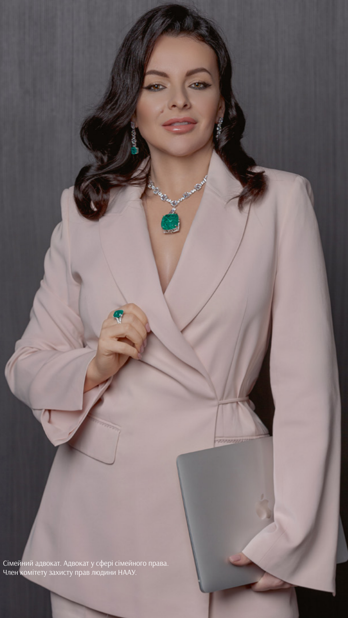
Сімейний адвокат. Адвокат у сфері сімейного права. Член комітету захисту прав людини НААУ.