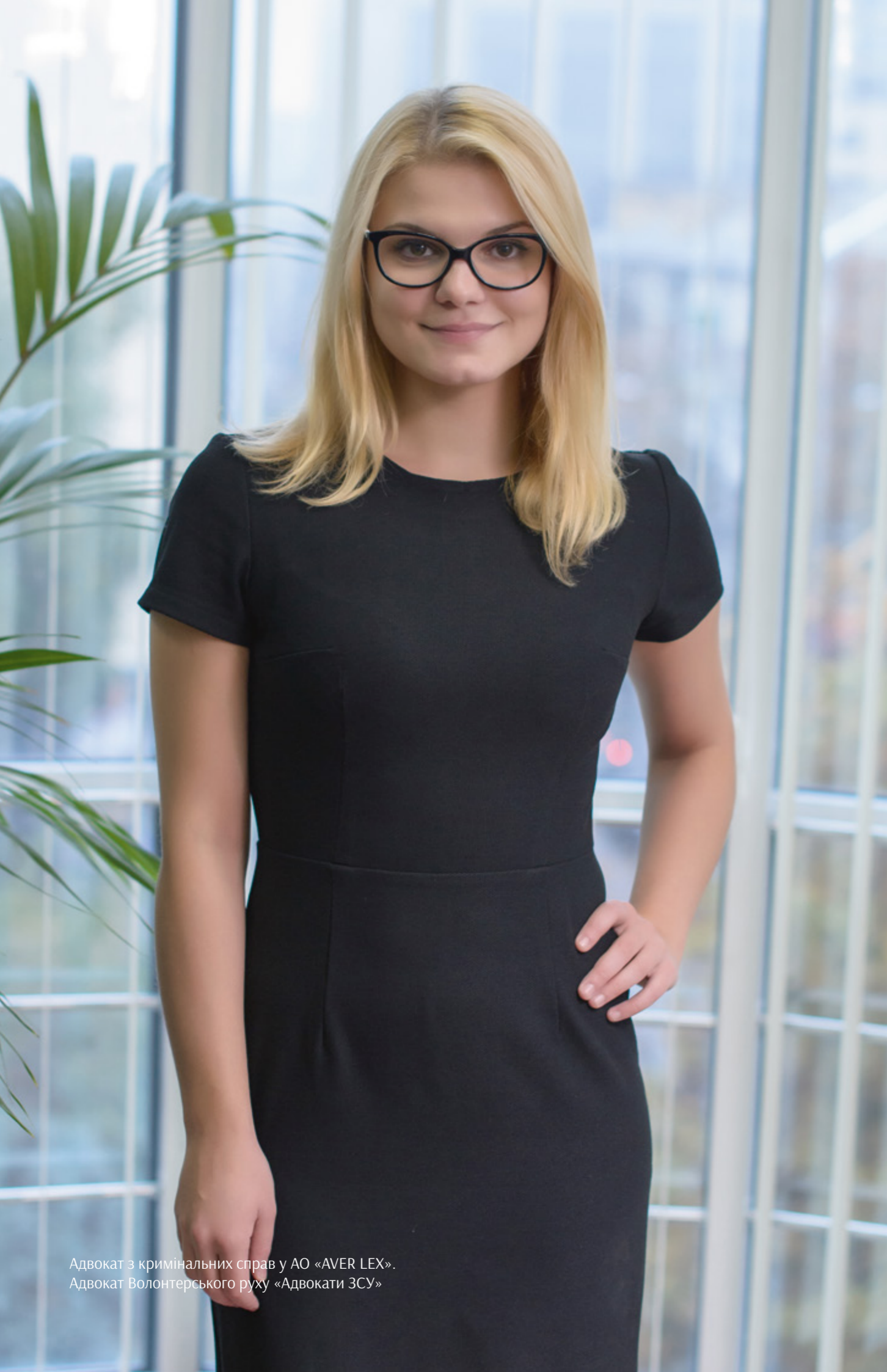
Адвокат з кримінальних справ у АО «AVER LEX». Адвокат Волонтерського руху «Адвокати ЗСУ»