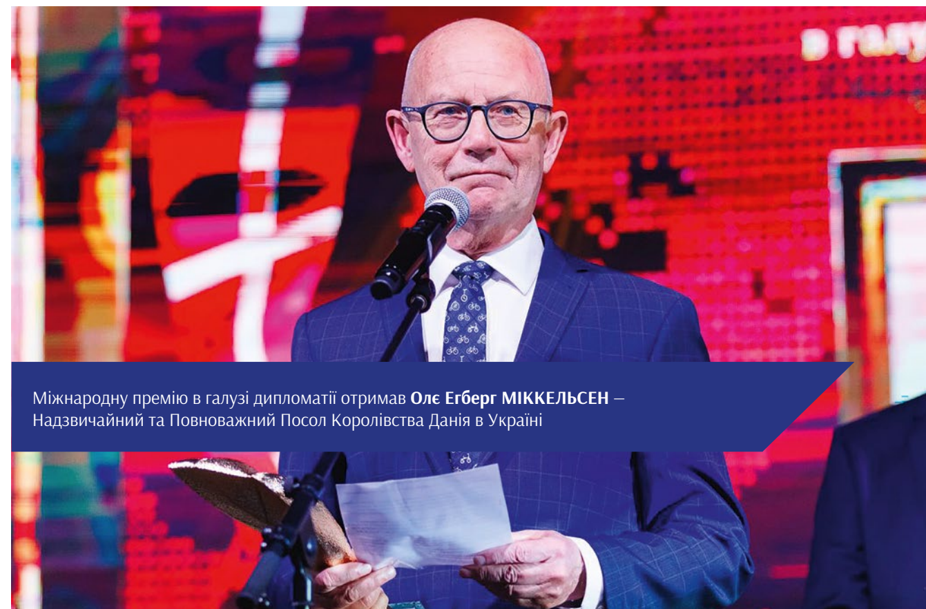
Міжнародну премію в галузі дипломатії отримав Оле Егберг МІККЕЛЬСЕН — Надзвичайний та Повноважний Посол Королівства Данія в Україні

Катерина САДУРСЬКА — багаторазова чемпіонка та рекордсменка світу з фрідайвінгу, чемпіонка Європи та призерка чемпіонату світу з синхронного плавання, учасниця Олімпійських ігор у Ріо-де-Жанейро 2016 — «За незламну силу духу, волю до перемоги та місію амбасадора України у спорті високих досягнень»