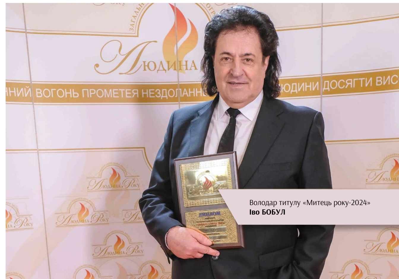
Володар титулу «Митець року-2024» Іво БОБУЛ